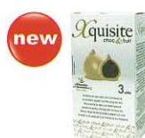
ホワイトチョコレート プラリネ入り(3&9ピース)