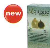
ホワイトチョコレート トリフ・ブランデー入り(3&9ピース)