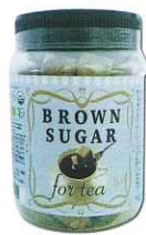
オーガニック ブラウンシュガー300gx12個/Case

有機栽培されたサトウキビを搾り煮詰めて乾燥させて角砂糖にしました。紅茶、特にミルクティーにぴったりです。