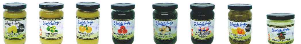
レモンカード ライムカード オレンジカード ラズベリーカード アップル・プラム & シナモンジャム ミンスミート ステムジンジャー ブランデーバター