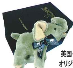
英国・メリーソート社製 オリジナル象のぬいぐるみ