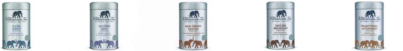
Fine Earl Grey アールグレイ Fine Duchess Grey ダッチェスグレイ Fine Kenyan High Grown ケニヤンハイグロウン Fine English Breakfast イングリッシュブレックファースト Fine Traditional Afternoon トラディショナルアフタヌーン