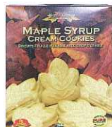
メープルシロップ クリームクッキー 350gx12箱/Case