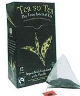
Fine Green Kenyan High Grown