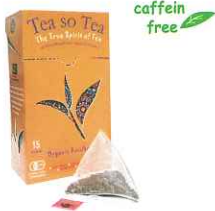
Fine Green Kenyan High Grown