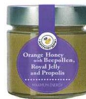
オレンジハニー (花粉・ロイヤルゼリー・プロポリス配合) 300gx9個/Case

スペイン産のオレンジの花から採れたはちみつに花粉とロイヤルゼリーとプロポリスを配合しました。とても濃厚な味わいでそのまま食べても美味しくいただけます。