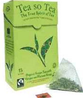
Fine Green Kenyan High Grown