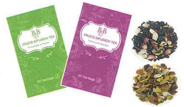
ハイビスカス&マンゴー 5g ピーチ&アップル 5g

ノンカフェインのフルーツティーです。フルーツティーとしてはもちろん、ワインに入れば簡単に自家製サンギリアの完成です。ビールにもよく合います。