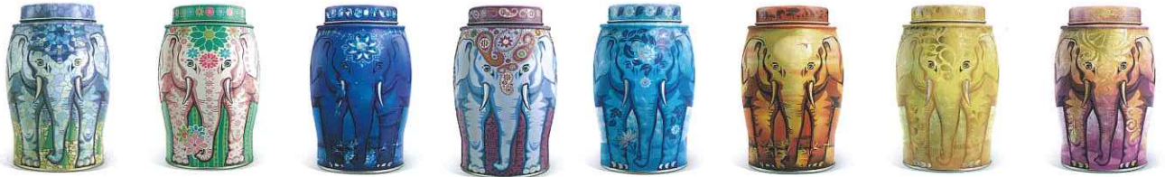
スタンドグラス スプリングフローラル ケニヤントワイライト ペイズリー アールグレイwithブルーフラワー ケニヤンサンセット レモンサンシャイン パープルブラッシュ