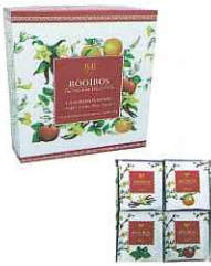
アソートフレーバー・ ルイボ스티ー 40P (4種類 x 10P) x24箱/Case

B&Bのルイボ스티ーは、4種類の違ったフレーバーがたっぷり40パック入っています。フルーティーなアップルやオレンジ、甘い香りのバナラ、さわやかな味わいのミントなど、その日の気分や雰囲気に応じてお楽しみください。