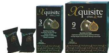
プラリネ入り(3&9ピース)

1982年創業のエクスメサ社によって作られています。チョコレートは、ベルギーのバリーカレポー社のチョコレートを使用。