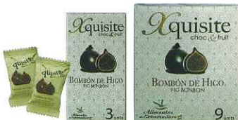
トリフ・ブランデー入り(3&9ピース)