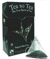
Fine Green Kenyan High Grown