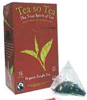
Fine Green Kenyan High Grown