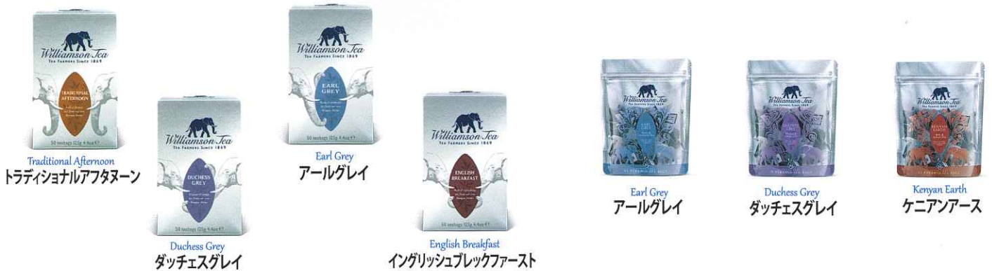
Traditional Afternoon トラディショナルアフタヌーン Duchess Grey ダッチェスグレイ Earl Grey アールグレイ English Breakfast イングリッシュブレックファースト Earl Grey アールグレイ Duchess Grey ダッチェスグレイ Kenyan Earth ケニヤンアース