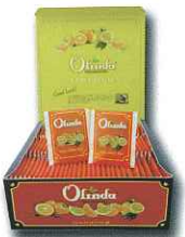
Earl Grey Tea 100P アールグレイ100P 2gx100Px12箱/Case

オリンダはスリランカ中央部、1000~1200mの高地で栽培された茶葉にフルーティーな香りをつけた紅茶です。飲んで頂いた皆さんに幸運と成功がもたらされますようにと願いをこめて作られております。