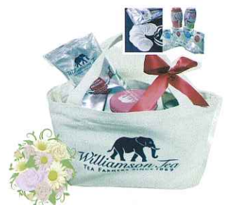
トートバック サイズ:W34x H17x D12cm