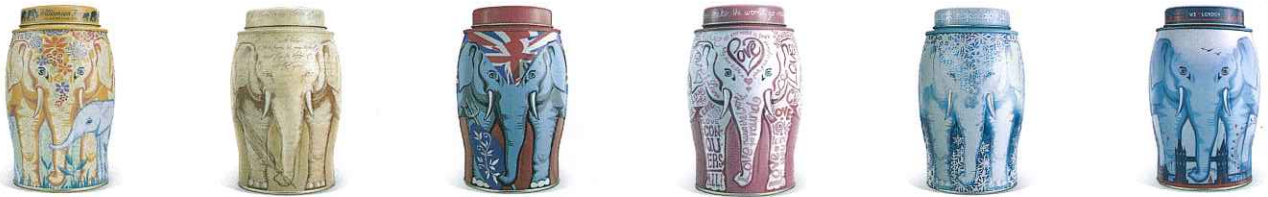
マザーアンドチャイルド ディケンズ プリタニア ピンクラブ スノーフレーク ロンドン